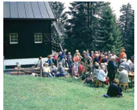
La cabane fête ses 10 ans en 1993