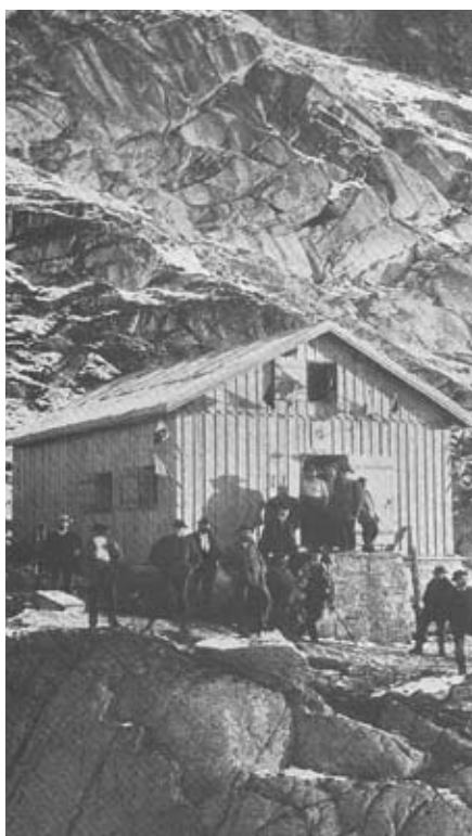
Inauguration de la cabane d'Orny en Valais, le 24 septembre 1893.

Une histoire peu banale entoure la cabane Orny II, déplacée voici quelque 25 ans du Massif du Trient dans les Alpes valaisannes à la Dent de Vaulion, dans le Jura vaudois. Une charmante cabane de 18 places sise dans un écrin de verdure, surplombant un paysage grandiose, qui sous des apparences aujourd'hui débonnaires, cache un vécu mouvementé de 115 ans.