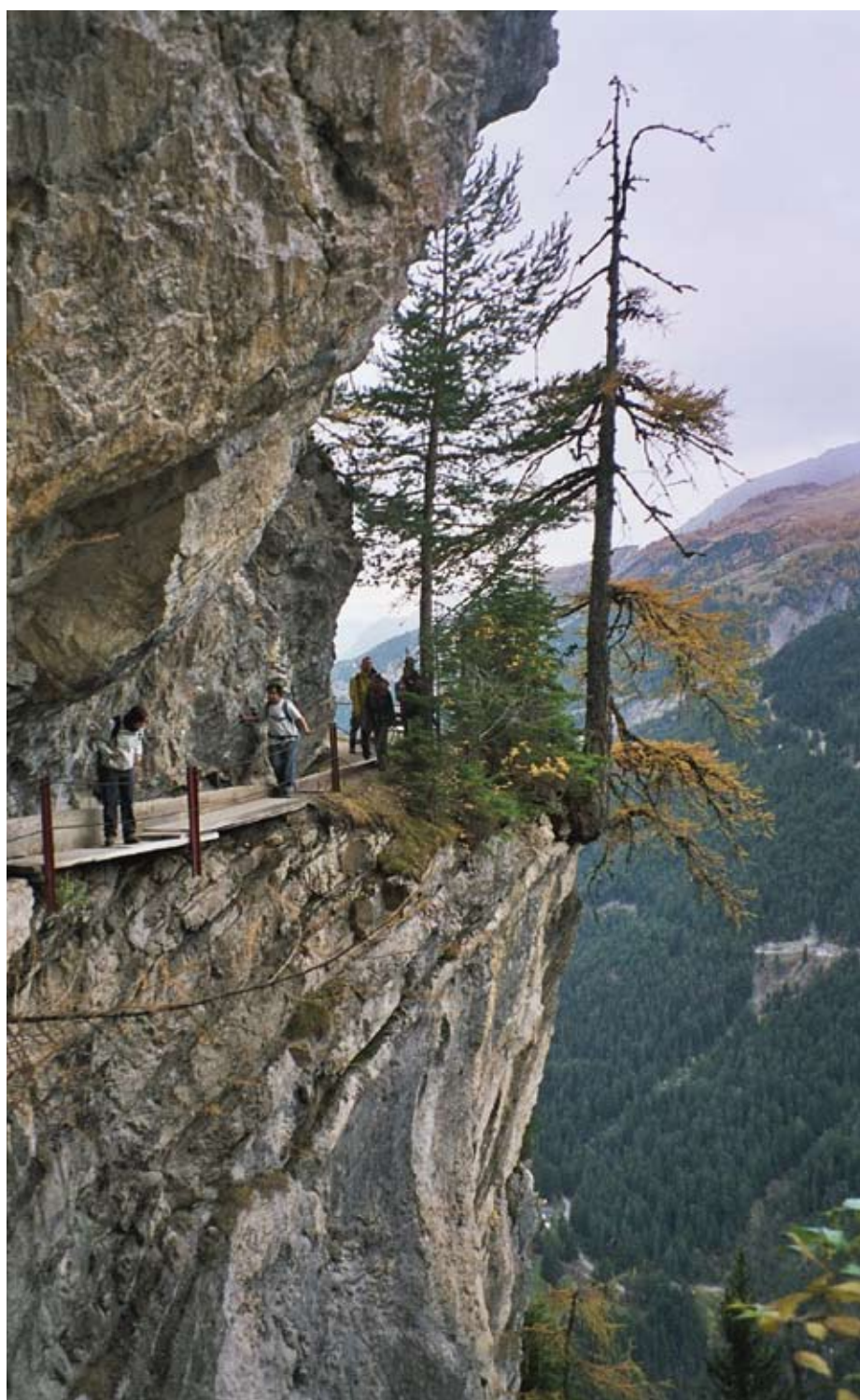
Page de gauche: montée à la Croix-de-Fer depuis le Col de Balme Ci-contre: bisse du Rô

D'ores et déjà, une équipe de choc se tient à disposition pour la préparation de sorties, le prêt du matériel, l'accueil des nouveaux membres, le contrôle et l'entretien du matériel, l'estimation des difficultés et la mise au point du programme.