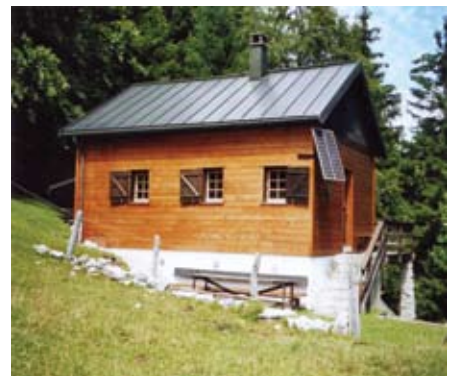
Orny II à Vaulion