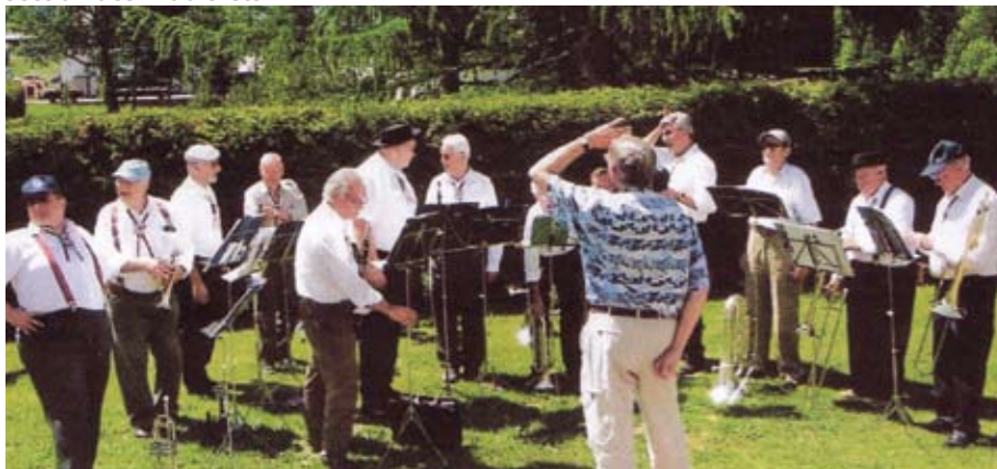
La Musique d'Anzeinde, formation de la section des Diablerets

Le dimanche 15 juin sera consacré à la découverte de la région. Une randonnée nous conduira de Vallorbe au Pont en passant par la Dent-de-Vaulion et les mines du Grand-Crêt, autrefois consacrées à l'exploitation du calcaire à chaux et aujourd'hui le paradis des spéléos néophytes.