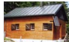
Salut Jolie Cabane

Jolie cabane, te souviens-tu? De tes origines, des hautes cimes, Du glacier et des grands rochers? De solides et courageux Morgiens T'ont mise en pièces, délocalisée Et rebâtie en d'autres horizons.